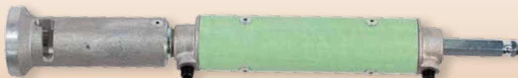
Esempio di composizione compensatore: CPT T5/C4